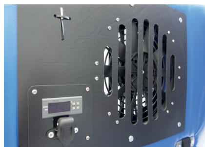
Lüfter mit Bedieneinheit

Sie ist in zwei Versionen erhältlich: die Version mit Lüfter (12 V oder 24 V) ermöglicht eine steuerbare Temperatur in beiden Zonen, ohne Lüfter kann die Temperatur nur in einer Zone geregelt werden.