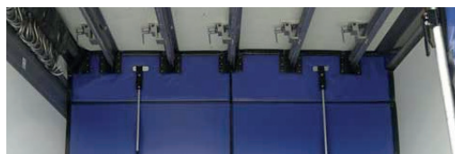
Auch um Fleischaufhängung abgedichtet