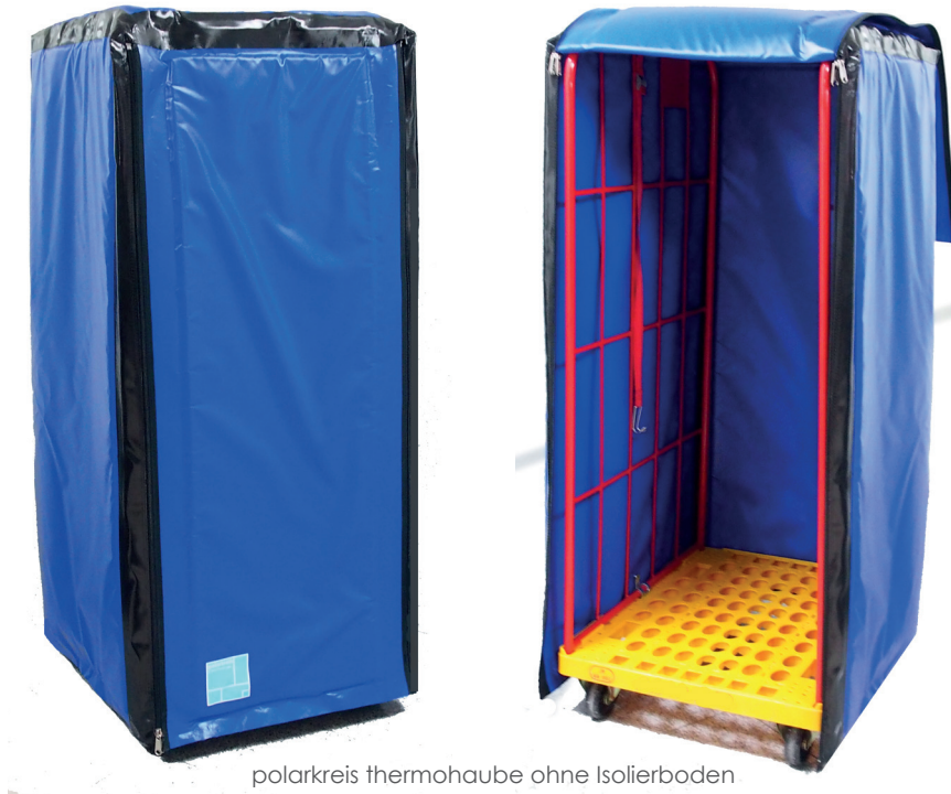
polarkreis thermohaube ohne Isolierboden

Die polarkreis thermohauben gibt es mit und ohne Isolierboden. Bei beiden Versionen stellen zwei Reissverschlüsse sicher, dass keine Luft von vorne in den Rollwagen eindringt. Bei der polarkreis thermohaube mit dem Isolierboden wird dieser zusätzlich noch mit einem Klettverschluss von vorne geschlossen.