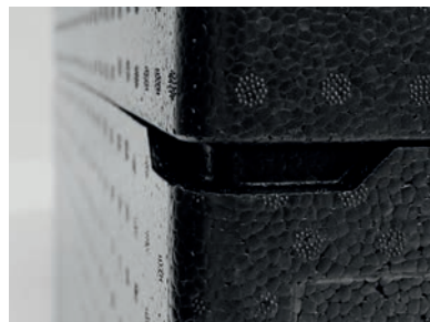
Die Eckenbuchtungen garantieren ein komfortables Öffnen der poxx.