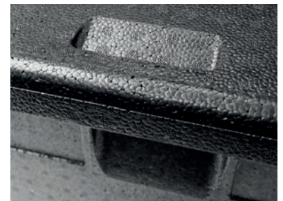
Mit den Griffschalen lässt sich die Thermobox gut tragen.